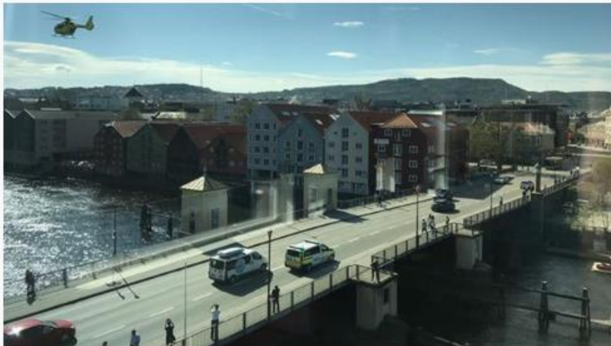
Mennskaper fra nødstatene på stedet der to personer ble hentet opp fra Nidelva torsdag ettermiddag.

Fredag ettermiddag var tilstanden fortsatt alvorlig for de to brødrene på 17 og 20 år som ble hentet opp av Nidelva i Trondheim torsdag.