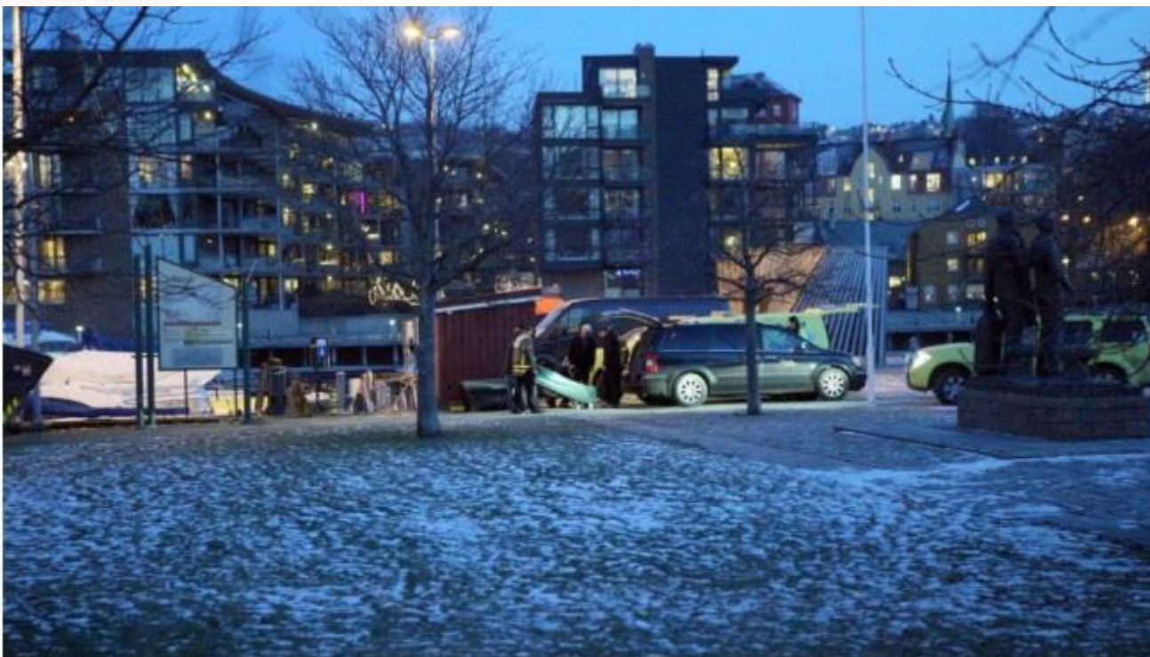
FUNNET I ELVA: En person ble funnet død i Nidelva ved 15-tiden tirsdag.